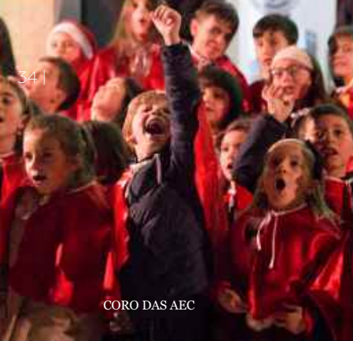
CORO DAS AEC