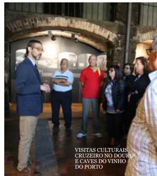
VISITAS CULTURAIS CRUZEIRO NO DOURO E CAVES DO VINHO DO PORTO

Em outubro, o Festival Sénior marcou o arranque do Programa VIVER +, que oferece um conjunto de atividades ao longo de todo o ano assentes em quatro grandes áreas de intervenção - Saúde & Bem-estar; Cultura & Lazer; Artes & Saberes; Solidariedade – e tem por objetivo promover o envelhecimento ativo e saudável, a aprendizagem ao longo da vida e o combate ao isolamento social, favorecendo a qualidade de vida dos seniores.