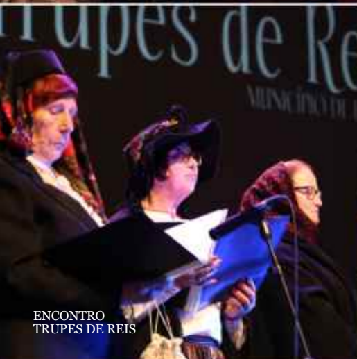
ENCONTRO TRUPES DE REIS

O "Natalim – Um Mundo de Sonhos que não tem fim" abriu com as vozes dos 175 pequenos cantores das AEC, inauguração da iluminação e decoração natalícia e a chegada do Pai Natal à Praça Francisco Barbosa, marcando um mês inteiro de programação dedicada à época mais especial do ano.