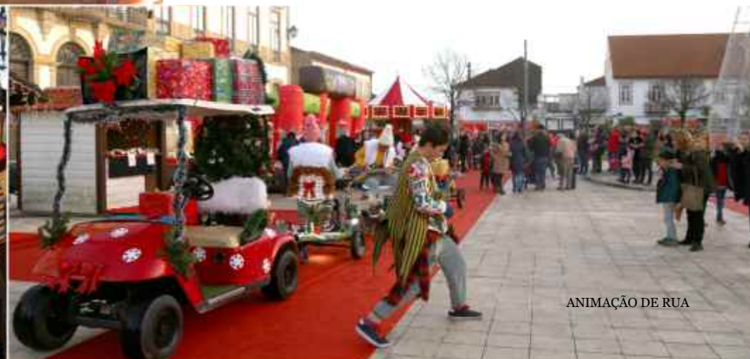
ANIMAÇÃO DE RUA