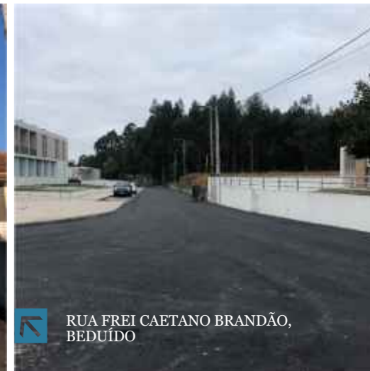
RUA FREI CAETANO BRANDÃO, BEDUÍDO