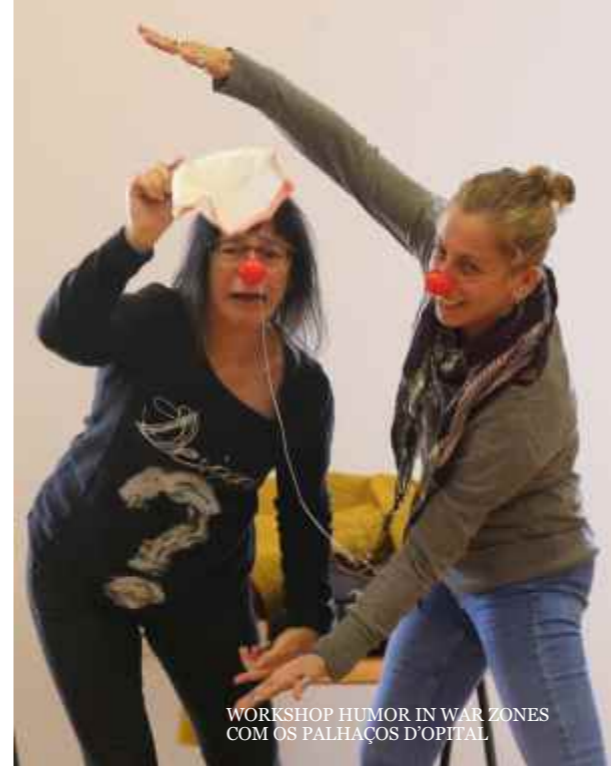
WORKSHOP HUMOR IN WAR ZONES COM OS PALHAÇOS D'OPITAL