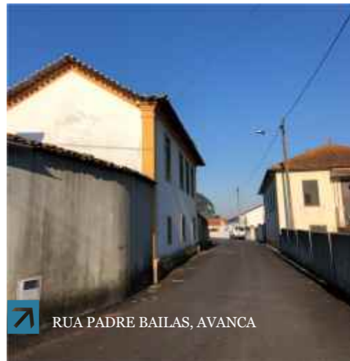
RUA PADRE BAILAS, AVANCA

Está em curso a empreitada de beneficiação de arruamentos municipais (dividida em 3 lotes) que abrange 22 vias de todas as freguesias do concelho. Já concluídas estão as intervenções de Avanca, Pardilhó e Beduído. Esta empreitada foi suspensa por causa do mau tempo e será retomada com as obras previstas para Veiros, Canelas, Fermelã e Salreu. O investimento municipal é de 390 mil€.