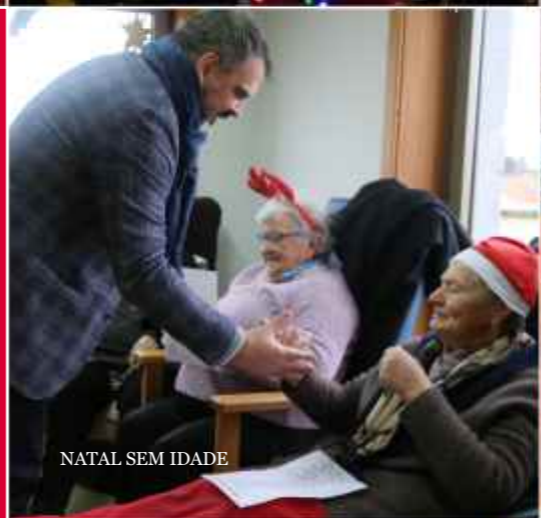
NATAL SEM IDADE