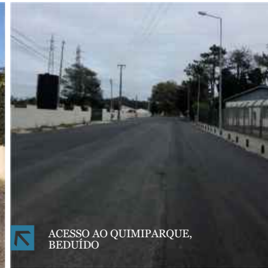
ACESSO AO QUIMIPARQUE, BEDUÍDO