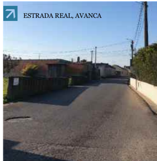
ESTRADA REAL, AVANCA