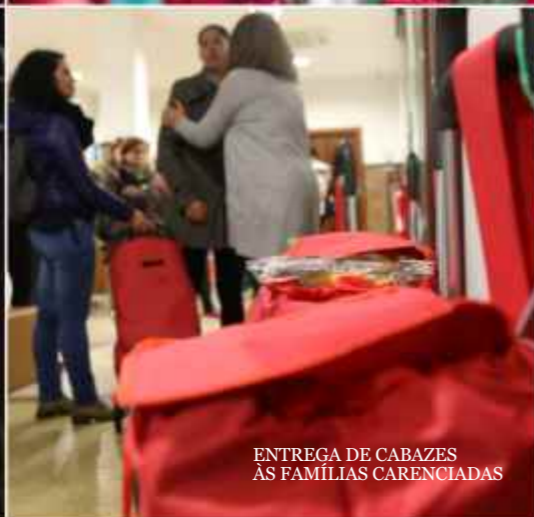
ENTREGA DE CABAZES ÀS FAMÍLIAS CARENCIADAS