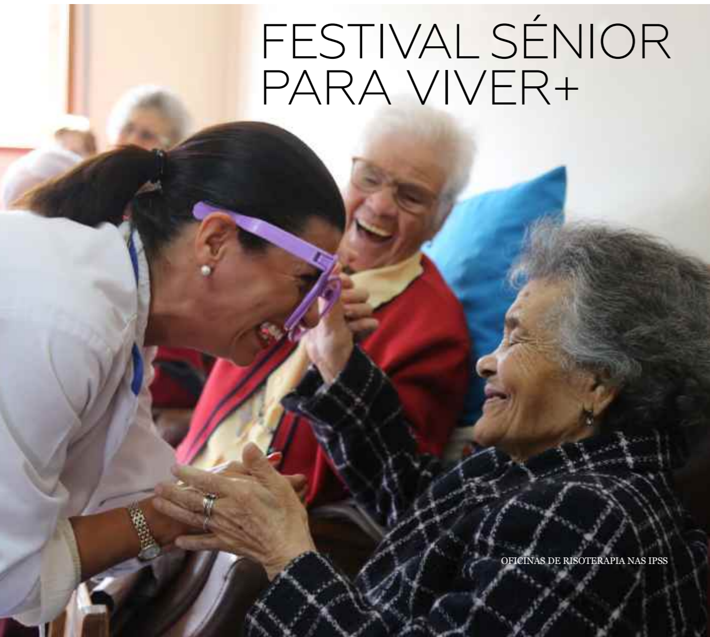
OFICINAS DE RISOTERAPIA NAS IPSS