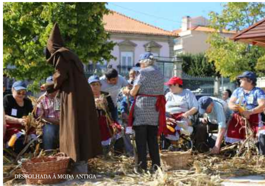
DESFOLHADA À MODA ANTIGA