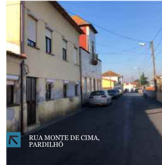
RUA MONTE DE CIMA, PARDILHÓ