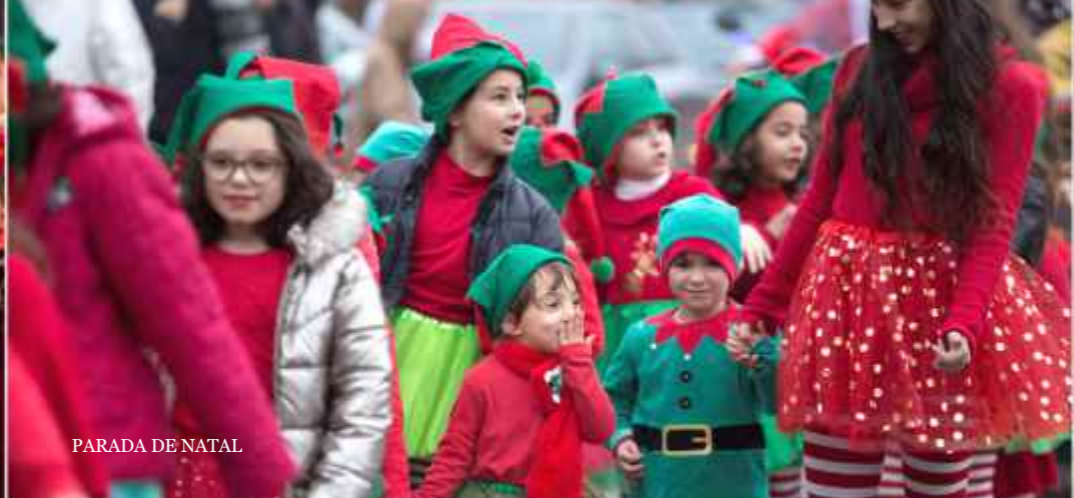
PARADA DE NATAL

O "Natalim – Um Mundo de Sonhos que não tem fim" abriu com as vozes dos 175 pequenos cantores das AEC, inauguração da iluminação e decoração natalícia e a chegada do Pai Natal à Praça Francisco Barbosa, marcando um mês inteiro de programação dedicada à época mais especial do ano.