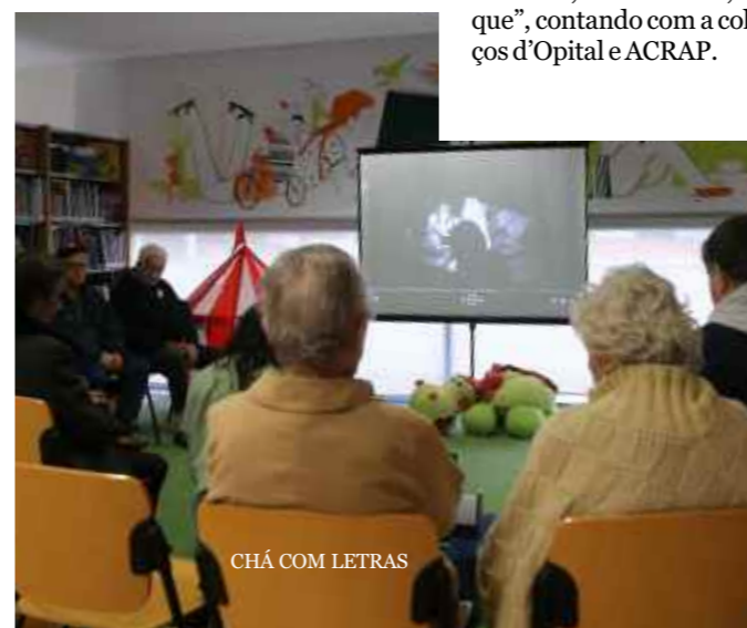
CHÁ COM LETRAS